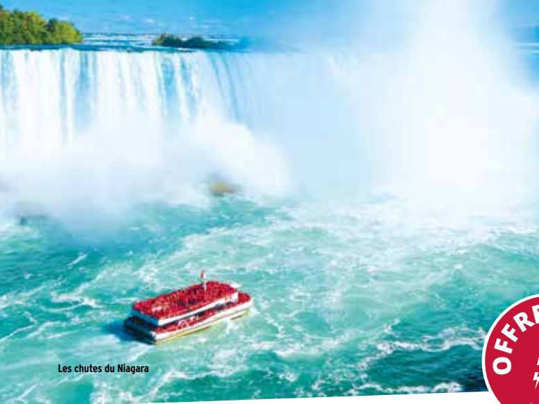
Les chutes du Niagara

(taxes d'aéroports et de sécurité obligatoires incluses, révisables)